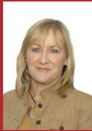
Sinn Féin Imelda Munster