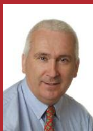
Fianna Fáil Declan Breathnach