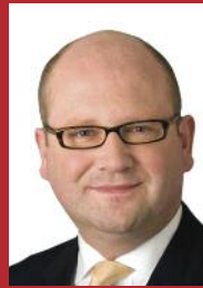
An Lucht Oibre Gerald Nash