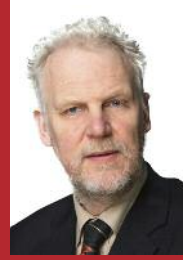
An Comhaontas Glas Olan Herr