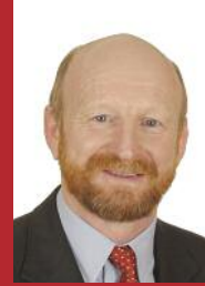
Fine Gael Anthony Donohoe