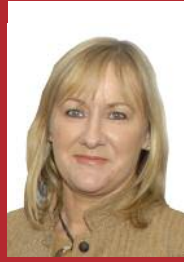
Sinn Féin Imelda Munster