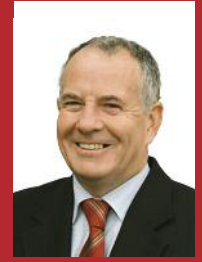
Fine Gael Oliver Tully