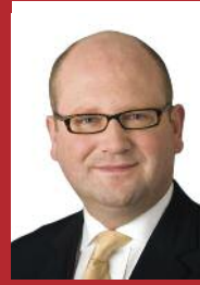
An Lucht Oibre Gerald Nash